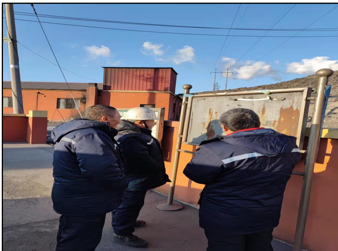
图3.2-4 现场张贴公告照片