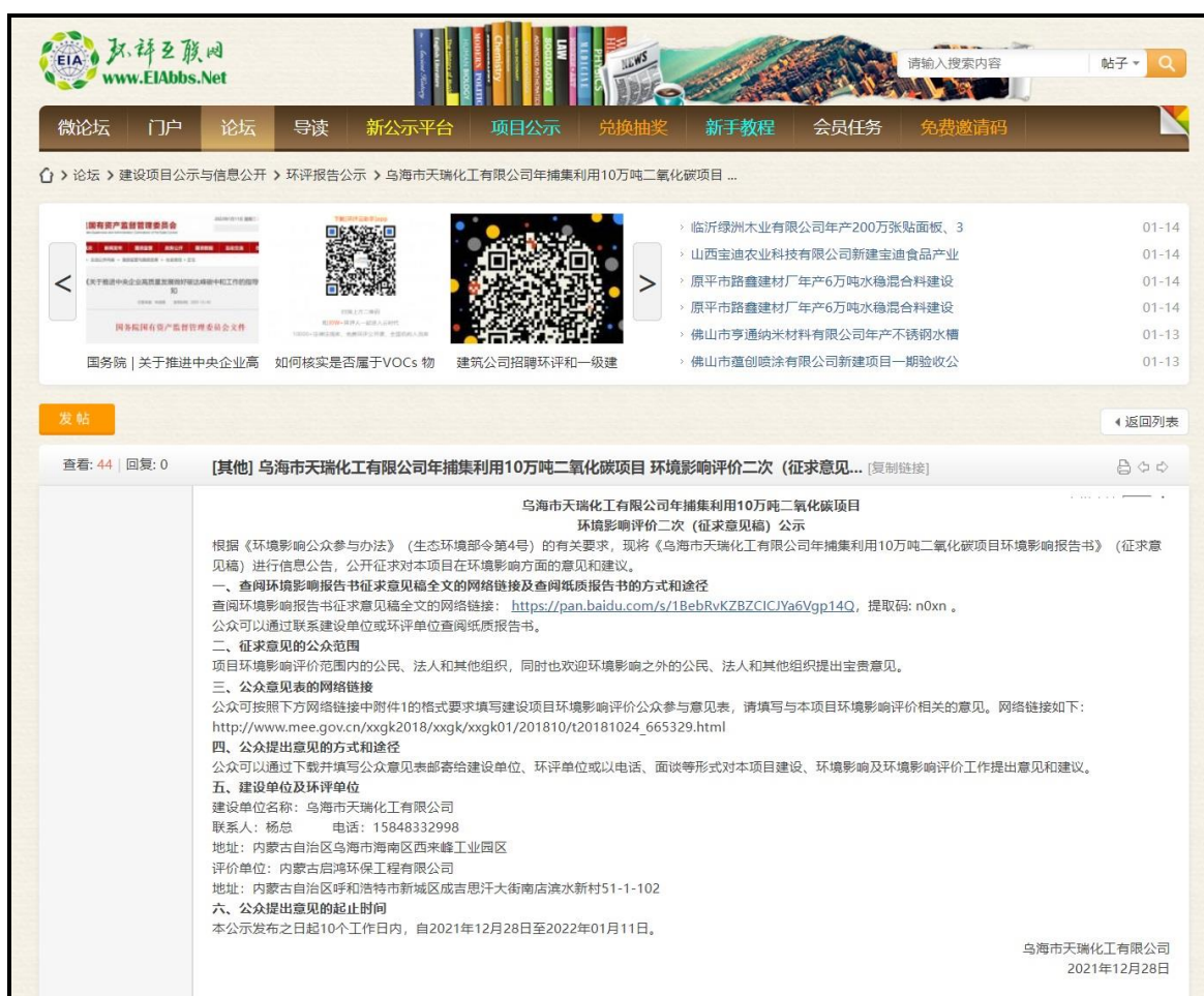
图3.2-1 征求意见稿公示截图