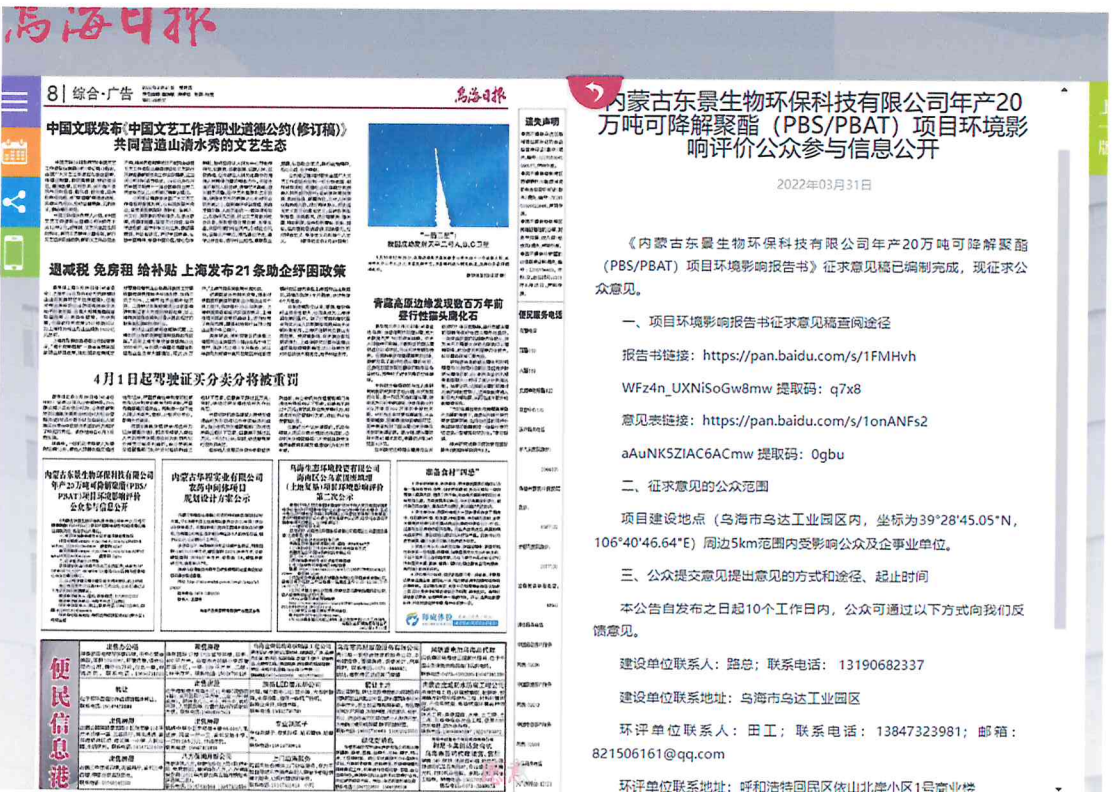
图 3.2-2 征求意见稿报纸公示