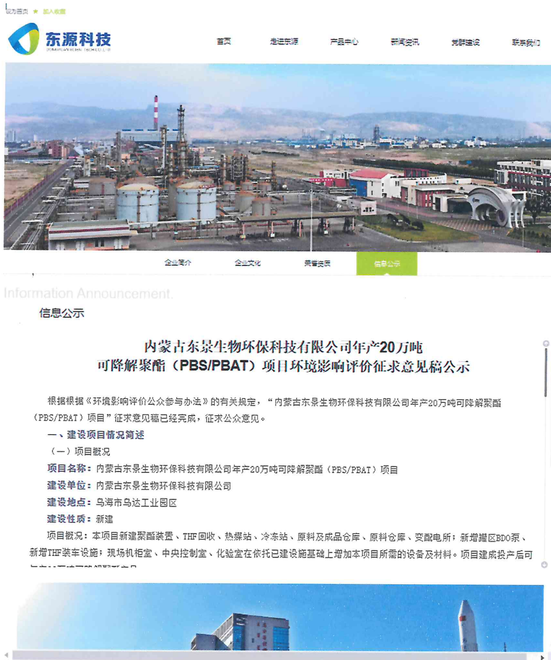
图 3.2-1 征求意见稿网站公示